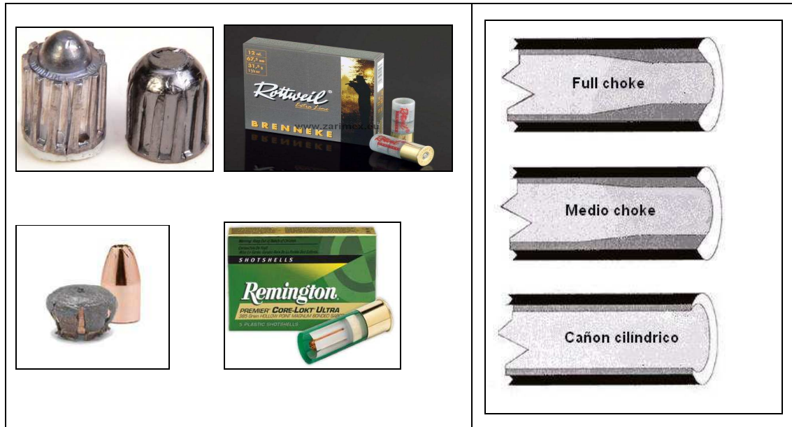
Figura 3. Detalle de cartuchos equipados con proyectil único tipo Brenneke y tipos de cañón de escopeta

Este proyectil, dada su alta transferencia de energía al momento del impacto, debido a su capacidad de deformación y diseño plano de la superficie frontal, no suele abandonar el cuerpo del ejemplar abatido. En los casos en que sí abandona el cuerpo impactado, suelen hacerlo con poca capacidad lesiva y considerablemente a menor velocidad, evitando con ello daños colaterales.