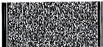
Timbre Electrónico SII

Res.99 de 2014 Verifique documento: www.sii.cl