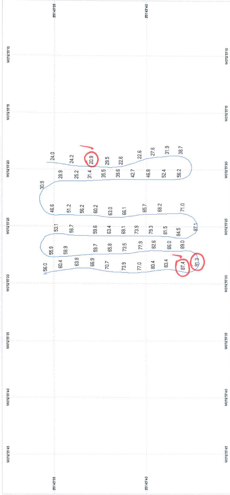
Plot of UserData.ADM Plotted: 10/09/2011 23:22:40, Tracks from 30/12/1989 23:59 to 30/12/1989 23:59