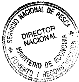
JUAN RUSQUE ALCAÍNO DIRECTOR NACIONAL DE PESCA